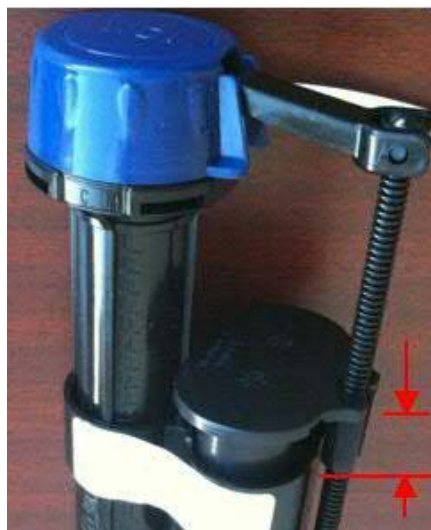
Incorrect car il y a un espace entre le flotteur intérieur et extérieur