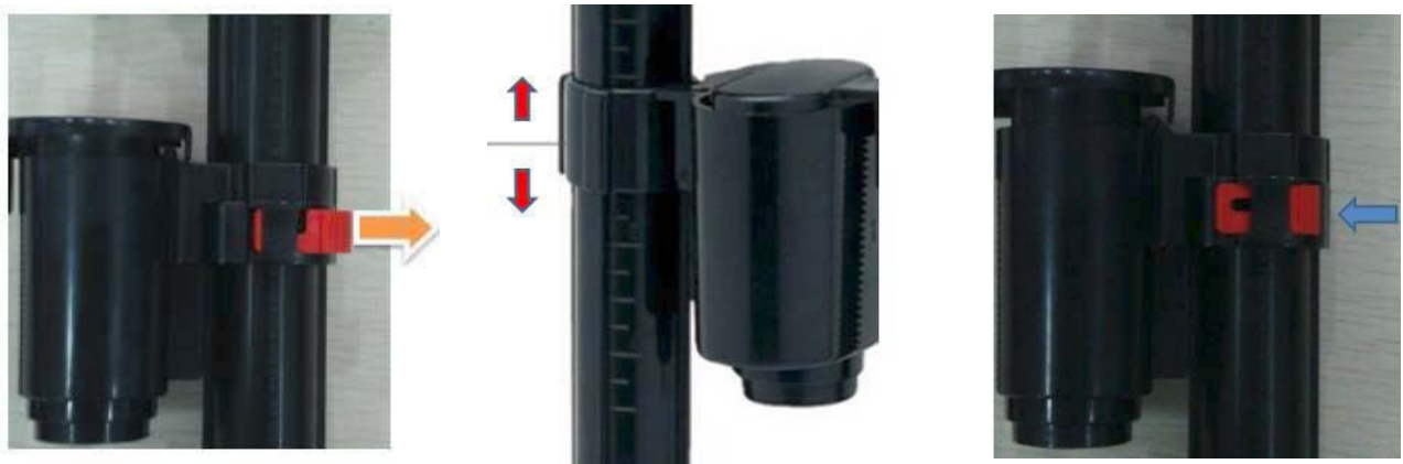
Relâchez l'anneau rouge (Figure 5)