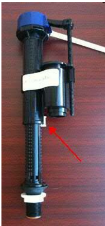
Comment verrouiller/déverrouiller la soupape de remplissage (Figure 1)