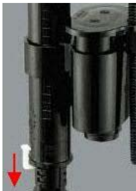
Retirer la goupille de verrouillage (Figure 8)