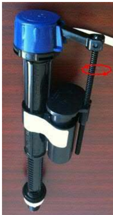
Comment régler le niveau d'eau du réservoir (Figure 2)