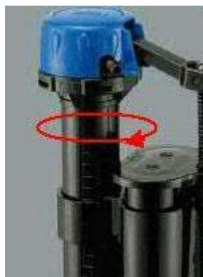
Tournez le corps de la soupape de remplissage de 1/8 de tour dans le sens antihoraire (Figure 9)