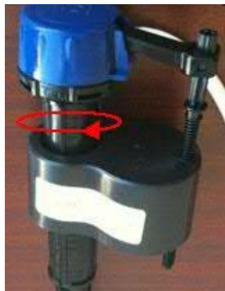
Tournez le corps de la soupape de remplissage de 1/8 de tour dans le sens antihoraire (Figure 4)