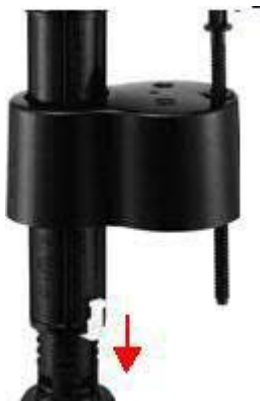
Retirez la goupille de verrouillage (Figure 3)