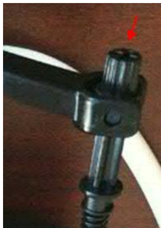
Comment régler la coupelle flottante (niveau d'eau à l'intérieur du réservoir) (Figure 2)